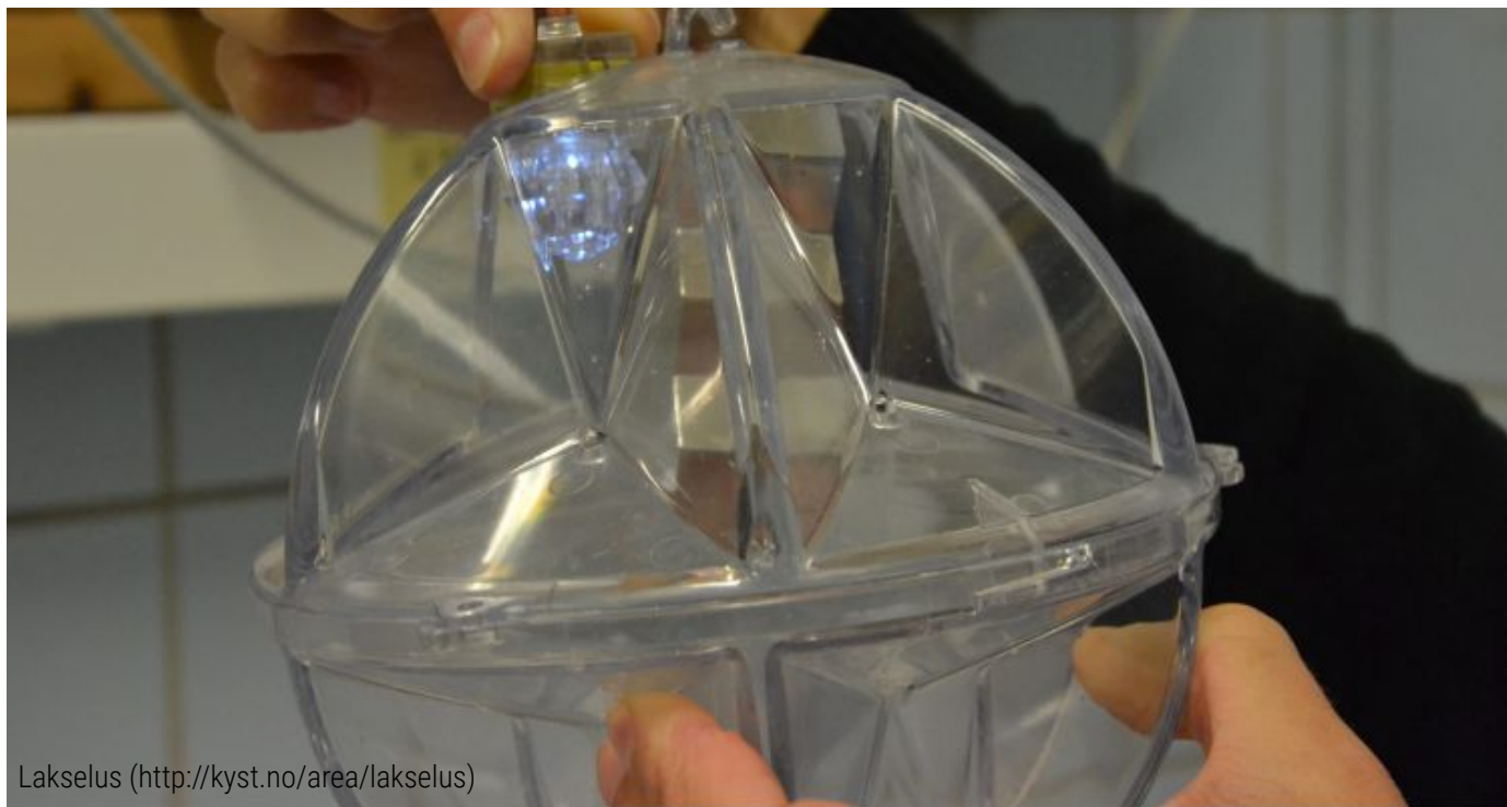
Lakselus ( http://kyst.no/area/lakselus )

Lakselus-felle utviklet av Havforskningsinstituttet. Foto: Magnus Petersen.